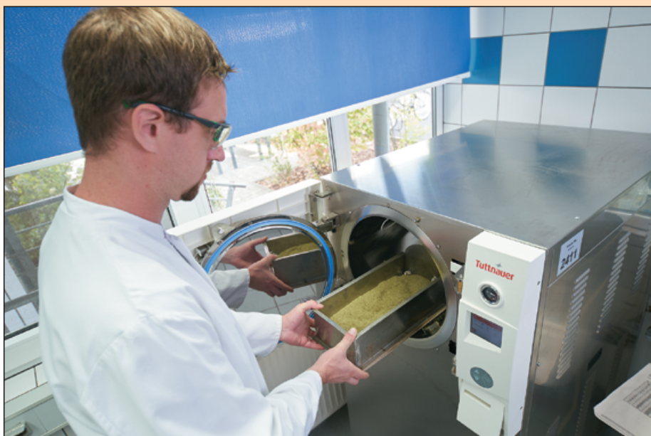
Abb. 2: Im Analyselabor lässt sich die Keimreduzierung von Kräutern und Gewürzen zu Versuchszwecken simulieren.

Im Fall der systematischen Kontamination kann man von einer umfangreichen Kontamination ausgehen. Auch Nachuntersuchungen bestätigen einen ersten Positivbefund durch viele positive Ergebnisse. Der Gewürzveredler ermittelt eine systematische Kontamination mit sehr hoher Wahrscheinlichkeit schon bei der Wareingangsanalyse eines Rohstoffs und nimmt eine Keimreduzierung der Charge vor. In der Praxis lässt sich dagegen eine zufällige Kontamination (Spot-Kontamination) im Rahmen der Wareingangskontrolle