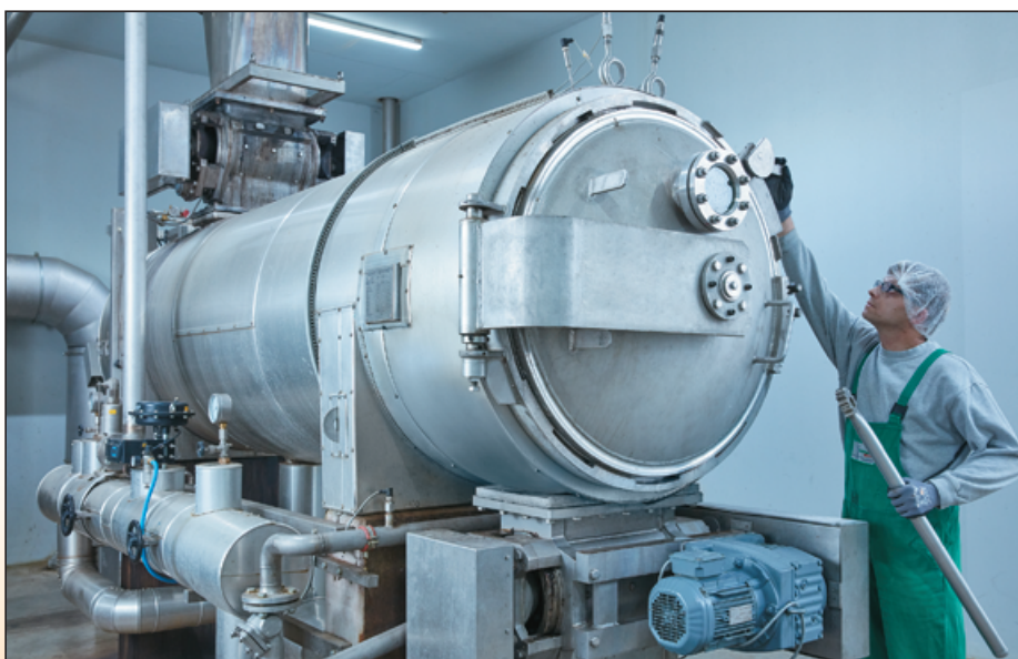
Abb. 1: Die Keimreduzierung durch natürliche Dampfbehandlung sorgt für die geforderte Lebensmittelsicherheit der Produkte.

Jährlich werden tausende Rohstoffchargenbefunde neu bewertet sowie die Probenahmepläne und Untersuchungen den festgestellten Risikoveränderungen angepasst. Auch die vorgesehene Verwendung eines Produkts wird bei der Risikobewertung berücksichtigt. Beim direkten Verzehr fällt