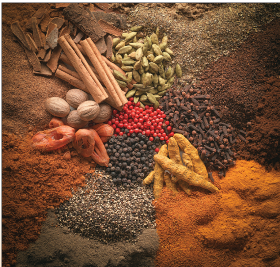
Abb. 3: Verschiedene Gewürze unterliegen einem hohen Salmonellenrisiko.

geeigneter Probengröße kein positives Ergebnis gemessen wird, obwohl „eine Salmonelle“ in der Charge vorhanden ist.